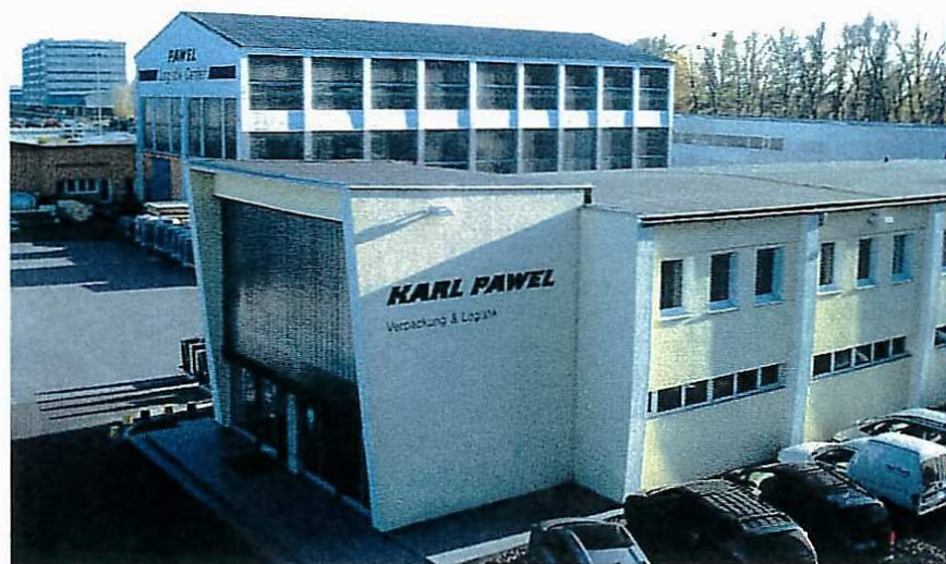
Blick auf den Standort der Firma Pawel in der Hellingsstraße 2 am Hafen Freudenau

ternehmen GmbH gegenüber austropack. Ende 2006 soll dann das größte Exportverpackungslogistikcenter Österreichs fertig gestellt sein. Die Firma Pawel legt seit jeher neben ökonomischen sehr viel Wert auf ökologische und auch soziale Aspekte. Und