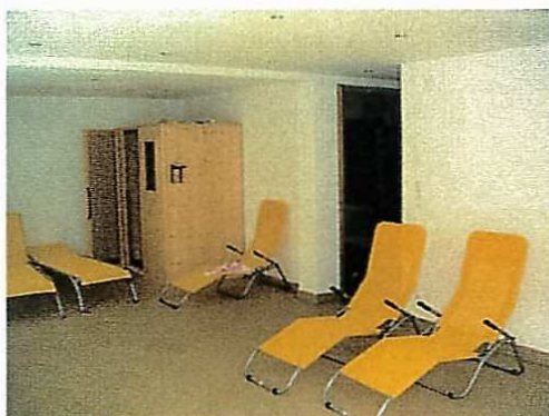
Auch an die MitarbeiterInnen wurde gedacht. Ein eigener Wellness-Bereich sorgt für ihr Wohlbefinden